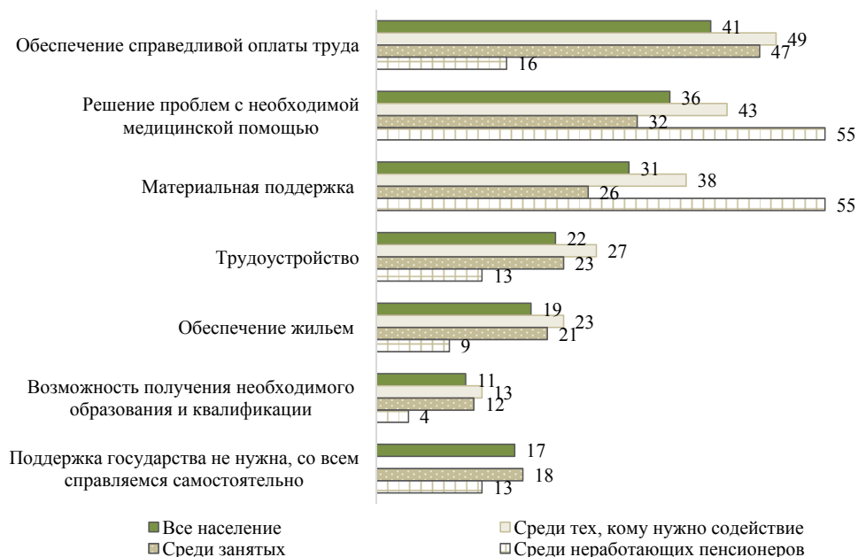
Рисунок 1. Проблемы, в решении которых населению необходима государственная поддержка, % (допускалось не более трех ответов)

Для операционализации различных типов запросов на государственную поддержку в зависимости от конкретных жизненных обстоятельств использовался вопрос о необходимом государственном содействии; распределение ответов на него представлено на рис. 1 2 .